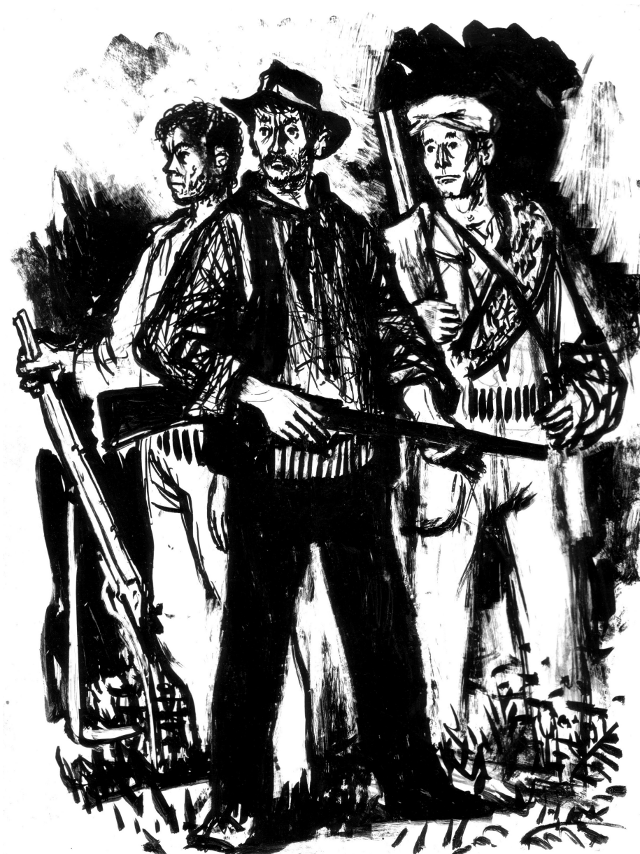
Illustration Lucien Fontanarosa- crédit Maurice Choury

Les Corses sous Vichy et l'occupation italienne ont l'honneur d'avoir compté une forte proportion de patriotes résistants prêts à mourir pour libérer leur île et peuvent être fiers de ne pas avoir fait déporter de juifs.